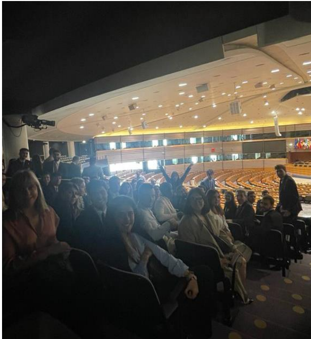
Ilustración 5: Ilustración 4: Foto grupo de los participantes del Rotary4Europe en el Parlamento Europeo.

de la EU, los estudios de seguridad, las respuestas a las crisis, entre otras cuestiones que engloban el marco de cooperación de los países miembros y la cooperación junto a otros estados fuera de la EU, charla dada por Giulio Venneri (Unit Thematic Support)