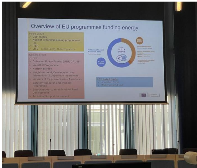
Ilustración 3: Presentación sobre Infraestructuras por la movilidad sostenible por Carlo De Grandis.

Además de conocer los proyectos relacionados con el cambio climático, tuvimos más charlas, una a destacar acerca de las negociaciones que mantienen con los países que quieren incorporarse en la unión europea y en los que ya pertenecen para cumplir con las políticas básicas democráticas, transparentes y legislaciones donde prevalezca el derecho humano por igual. Cuestiones que son imprescindibles detectar en nuestros países para asegurar el buen desarrollo de todos los proyectos de la EU.