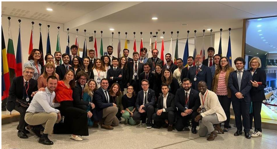
Ilustración 4: Foto grupo de los participantes del Rotary4Europe en el edificio del Parlamento Europeo.

Además de conocer los proyectos relacionados con el cambio climático, tuvimos más charlas, una a destacar acerca de las negociaciones que mantienen con los países que quieren incorporarse en la unión europea y en los que ya pertenecen para cumplir con las políticas básicas democráticas, transparentes y legislaciones donde prevalezca el derecho humano por igual. Cuestiones que son imprescindibles detectar en nuestros países para asegurar el buen desarrollo de todos los proyectos de la EU.