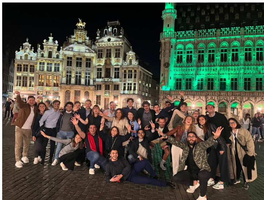
Ilustración 1: Foto de los participantes del Rotary4Europe en la Grand Place, Bruselas, Bélgica

Los pasados días 4 al 7 de junio tuvieron lugar los seminarios organizados por Rotary4Europe en Bruselas, celebrado en la Comisión Europea y en el Parlamento Europeo. Nuestro distrito Rotary 2202 fue uno de los patrocinadores de los seminarios y acudió Wasima como representante de nuestro distrito Rotary 2202 y Rotaract 2202.